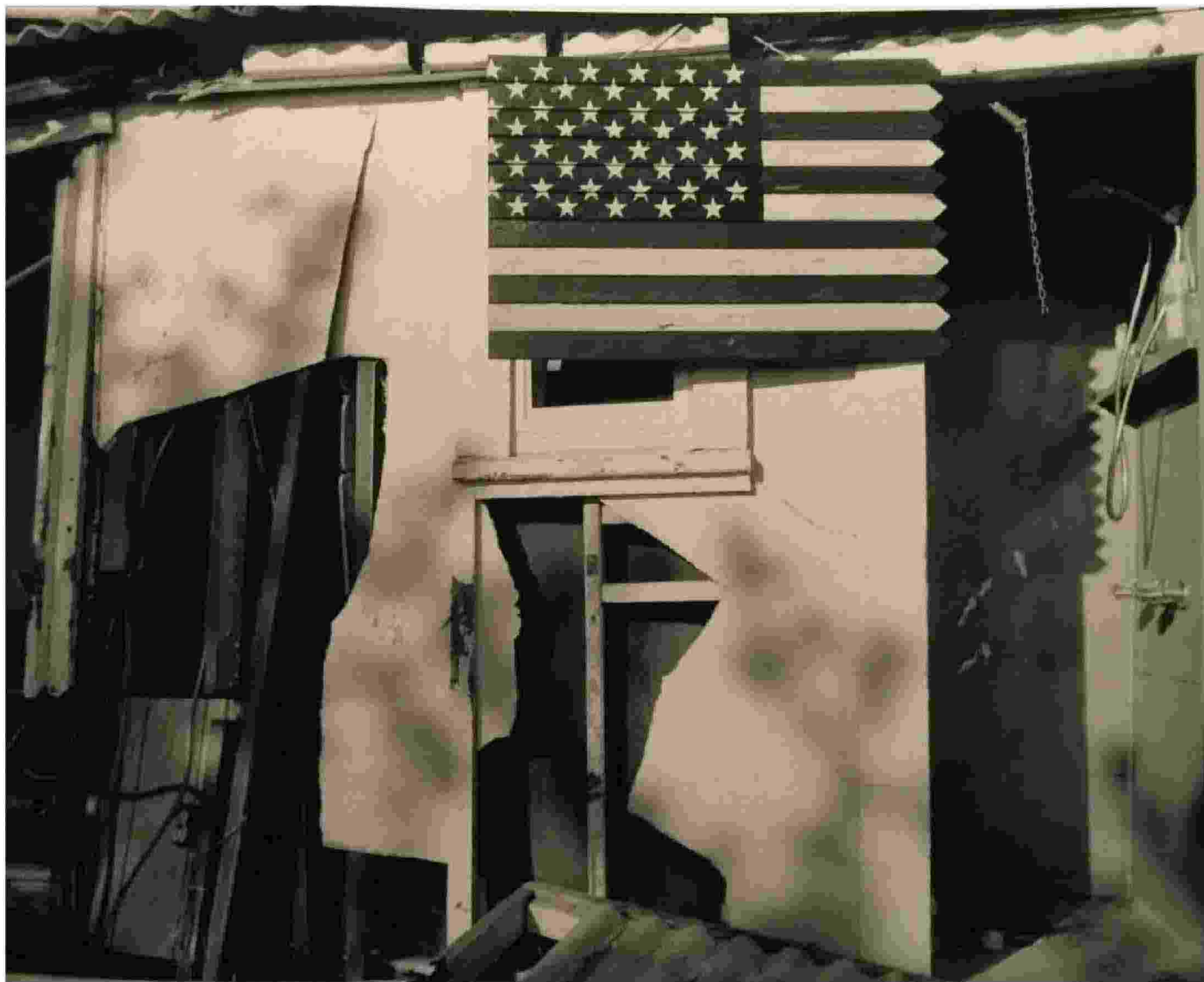
Altre tre immagini della mostra di John Pepper ospitata fino al 18 gennaio a Palazzo Cipolla a Roma nel Museo della Fondazione Terzo Pilastro-Italia e Mediterraneo