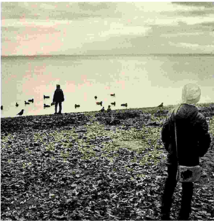
Due delle immagini della mostra «Evaporations» di John Pepper a Roma